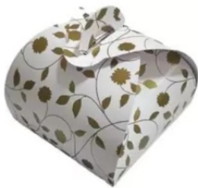
50 Embalagem Caixinhas Bem Casado floral dourado