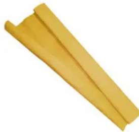
Papel Crepom Encerado 48cmx2m Ouro com 40 Unidades