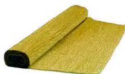
Folha De Papel Crepom 48cm X 2m